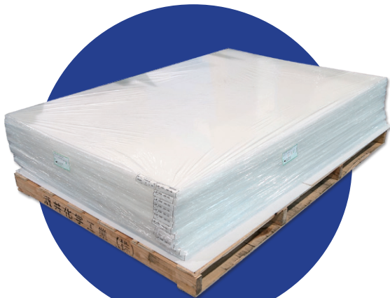
製造メーカー：酒井化学工業株式会社

建築現場、内装工事、引っ越し等の際に用いられる養生シートです。サイズと色が規格化されているため、標準のプラダンシートよりも納期を短縮できます。