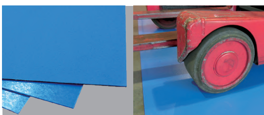
販売元：デザイン物流株式会社

床丈夫(ゆかじょうぶ)は、重量物・重量機器の搬出入に適した高剛性床養生用シートです。帯電防止加工済みでホコリが付きにくく、水・衝撃に強いため繰り返し何度でも使えます。